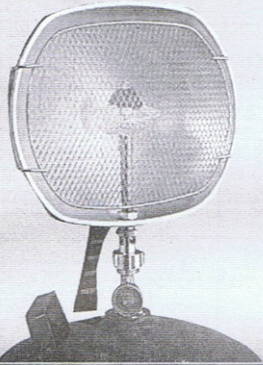
MOD. FARO PESCA